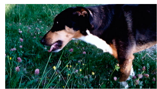
le philosphe est celui qui