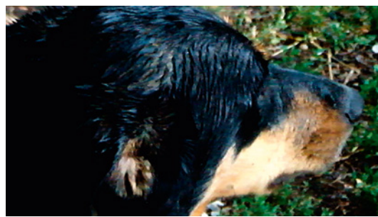
persone ne pourrait penser