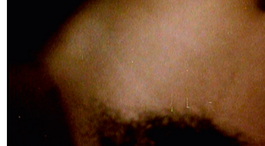
ils appellent le monde la forêt