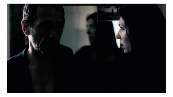
avoid, avoid, shattered memories