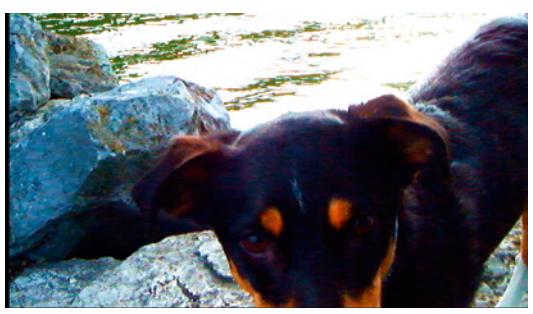
librement si ses yeux ne