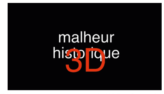
la société contre l'Etat