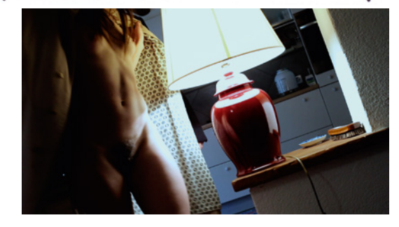
what's going on, end of