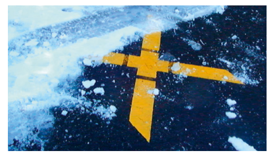
la tribu des Chikawahs,