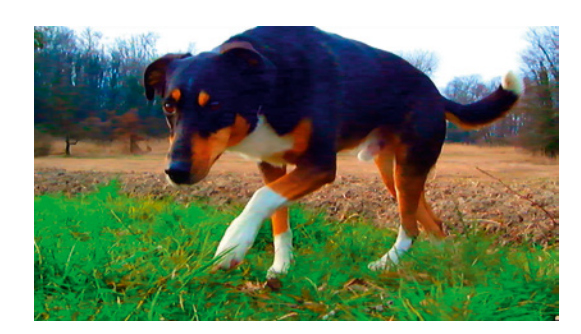
renoncez à la liberté