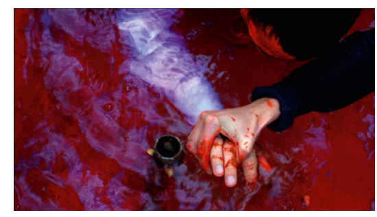
évite, et vite, les souvenirs brisés