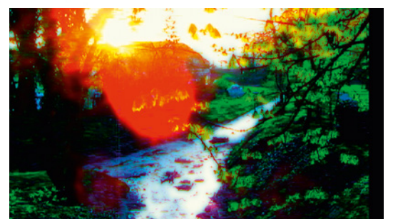
calls the world the forest