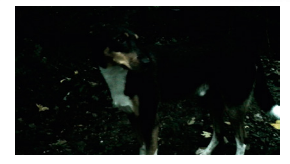
the philosopher is he who