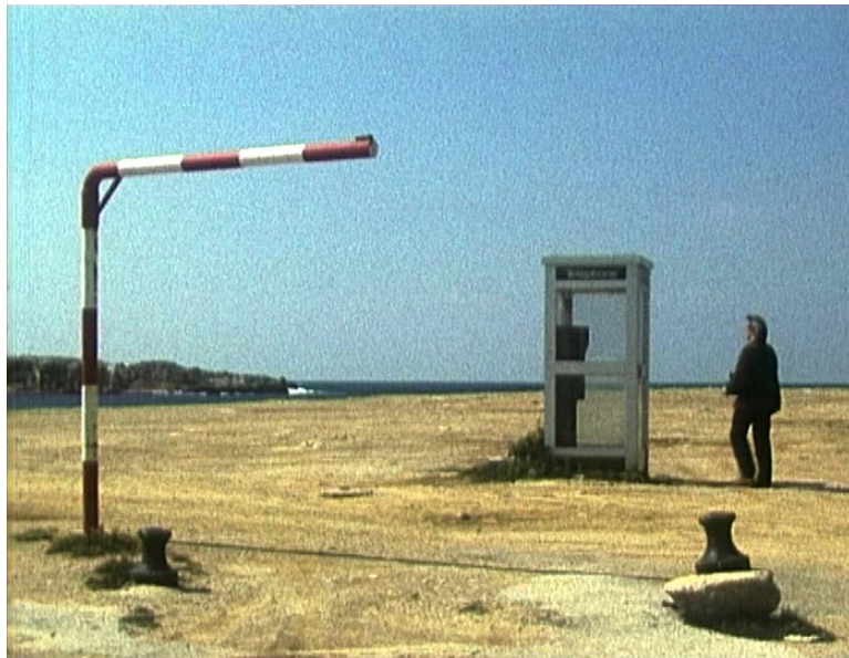
La Vallée close de Jean-Claude Rousseau