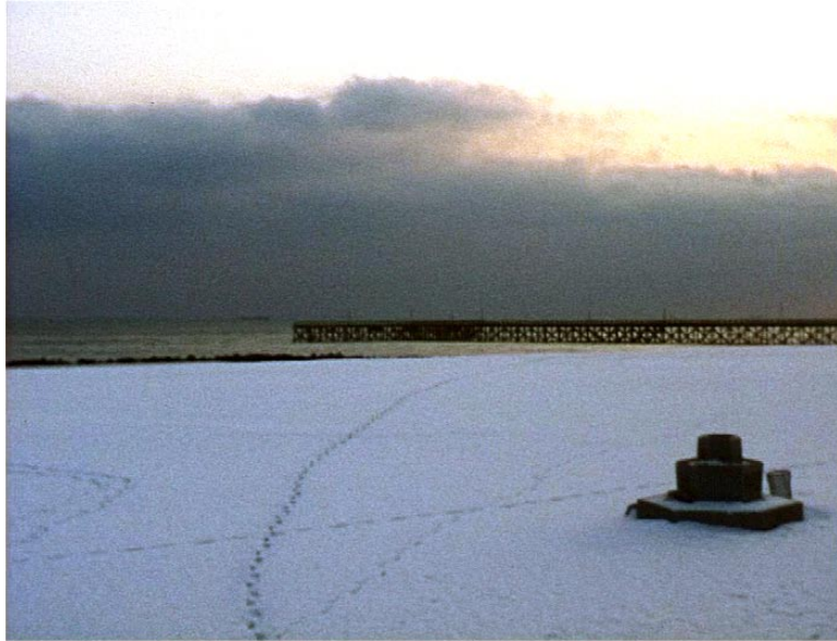
Keep in touch de Jean-Claude Rousseau